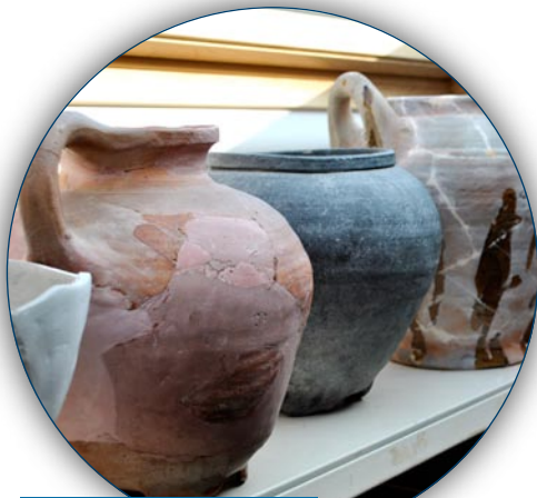
Aardewerk uit onze museale collectie