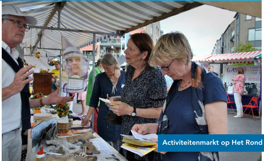
Activiteitenmarkt op Het Rond

opvang hebben wij opnieuw enkele workshops gegeven over archeologie en verhalen verteld over het verre verleden van Houten.