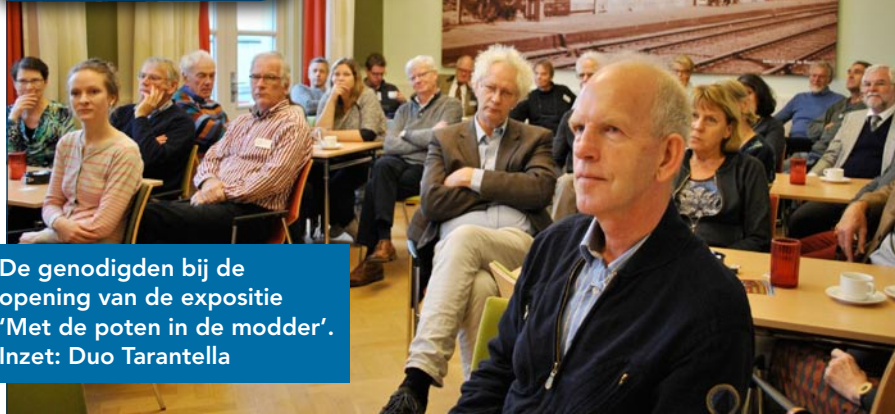
De genodigden bij de opening van de expositie 'Met de poten in de modder'. Inzet: Duo Tarantella