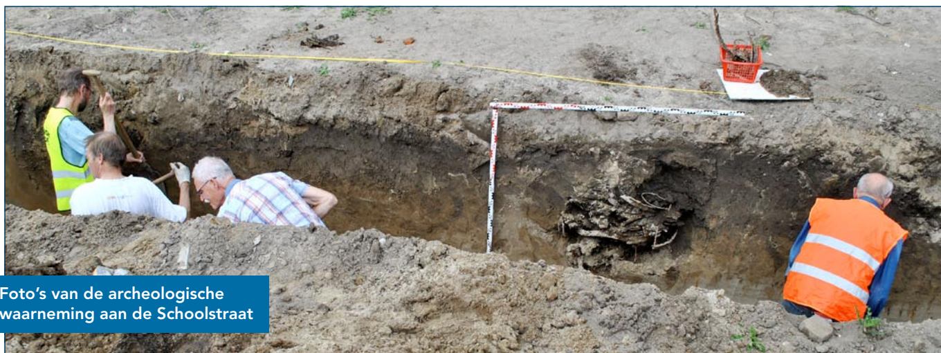
Foto's van de archeologische waarneming aan de Schoolstraat