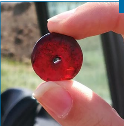
Opgraving Raaigras in Houten-Zuid, waarbij onze werkgroep betrokken is geweest

Onze tentoonstelling "Van IJzertijd tot nieuwbouwwijk" hebben we verlengd. Deze expositie is gewijd aan de grote opgraving in Houten-Castellum en verhaalt over de wisselwerking tussen de landschappelijke ontwikkeling en de menselijke bewoning op een deel van de Houtense stroomrug, vanaf de vroege IJzertijd. Bijzonder was onze deeloppositie "Bombardement en bevrijding Houten 1944/45", in het kader van