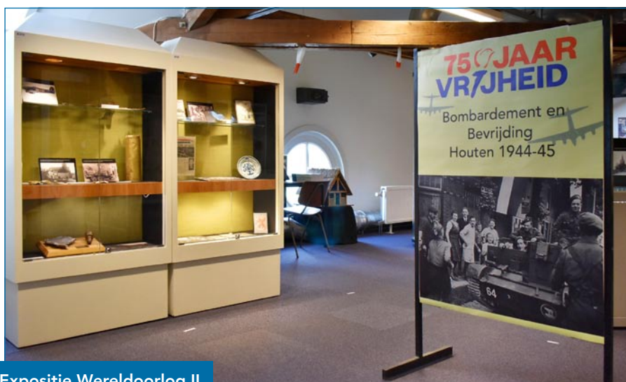
Expositie Wereldoorlog II

de nationale herdenking van “75 jaar bevrijding”. De tentoonstelling werd geopend door de voorzitter van het 4/5 mei Comité Houten. Via een schenking kwamen wij in het bezit van een fraaie archeologische collectie, afkomstig uit het Romeinse fort Vechten, in 1976 gereed uit de storthopen bij de verbreding van de A 12. Het zijn vondsten uit de Romeinse tijd. Deze collectie Muryis is te bewonderen op de archeologezolder. Enkele leden hebben gewerkt aan een kleine expositie over de verwerking van scherven in kunstzinnige creaties, met als werktitel “Oude scherven in een nieuw jasje”. De publieke belangstelling voor onze exposities was beperkt door de genoemde omstandigheden. We mochten 531 bezoekers verwelkomen. Dat is veel minder dan vorige jaren. Wel ontvingen wij studenten van de Reinwardt-academie, een delegatie archeologen van het opgravingsbureau ADC en groepen van het Houtense basisonderwijs. Het museum is twee dagdelen per week geopend, en wel op de dinsdagen en de zaterdag.