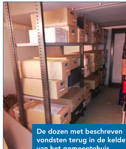
De dozen met beschreven vondsten terug in de kelder van het gemeentehuis

Toch hebben we het afgelopen jaar veel werk verzet. Een forse klus is de verwerking van opgeslagen archeologisch materiaal uit de kelder van het gemeentehuis. Dat materiaal, van opgravingen uit de jaren '70 en '80 van de vorige eeuw, hoort thuis in het provinciale